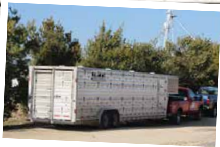
EIGEN TRANSPORT VAN BIGGEN

Door het transport van de biggen in eigen hand te nemen wordt het risico van insleep van PRRS verkleind. Ongeveer zeshonderd gespeende biggen kunnen in een keer worden meegenomen.