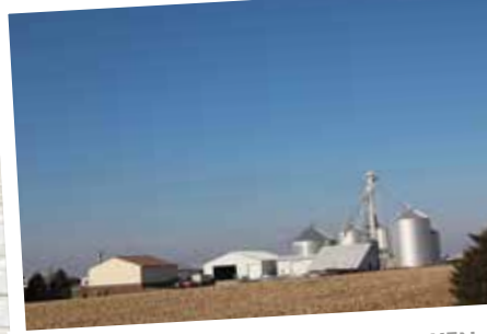
NATUURLIJKE BARRIÈRES ONTBREKEN

Door het transport van de biggen in eigen hand te nemen wordt het risico van insleep van PRRS verkleind. Ongeveer zeshonderd gespeende biggen kunnen in een keer worden meegenomen.