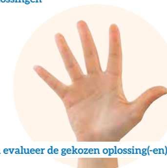
Implementeer én evalueer de gekozen oplossing(-en)