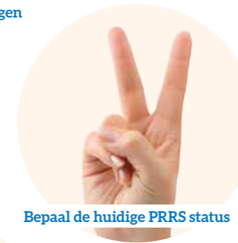
Bepaal de huidige PRRS status