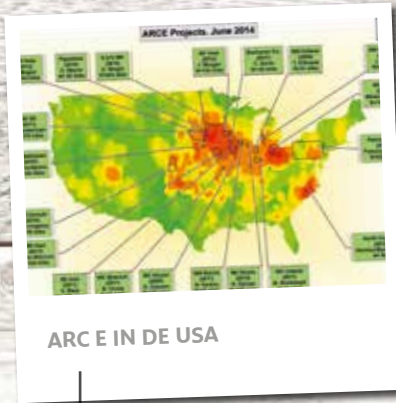
ARC E IN DE USA