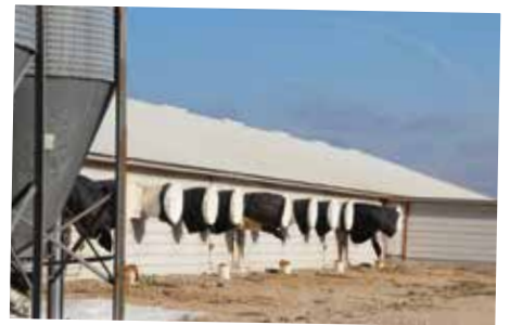
VENTILATIESOKKEN VOOR AFDICHTING VENTILATIEOPENINGEN

In het midwesten van Amerika bevinden veel varkensbedrijven zich "vrij in het landschap". Het aanplanten van bomen en planten rondom de bedrijven geeft windbreking en vermindert virus-verspreiding.