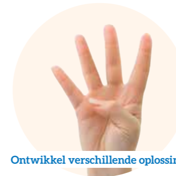
Ontwikkel verschillende oplossingen