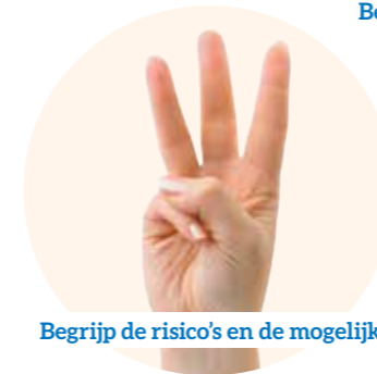
Begrijp de risico's en de mogelijkheden